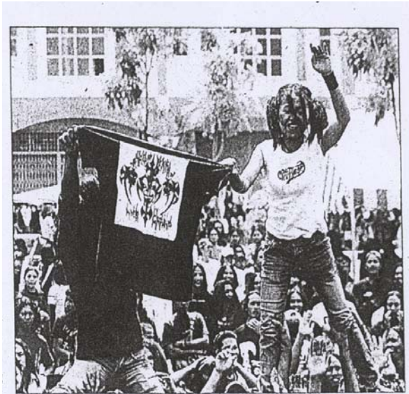
KIRA-KIRA 500 pekerja kilang dari Indonesia menyaksikan konsert 17 kumpulan muzik sempena ulang tahun ketiga Perayaan Halal Bihalal Bocahe Dewe di Taman Juara Jaya, Balakong, semalam.