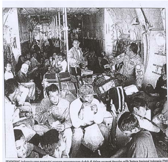
PENDATANG Indonesia menyertai program pengampunan duduk di dalam pesawat Hercules milik Tentera Nasional Indonesia (TNI) di Lapangan Terbang Sulta Abdul Aziz Shah, Subang, semalam.

Utusan Malaysia , 15 Disember: Rakyat Indonesia berdangdut atau menonton konsert “heavy metal” dalam suasana terkawal