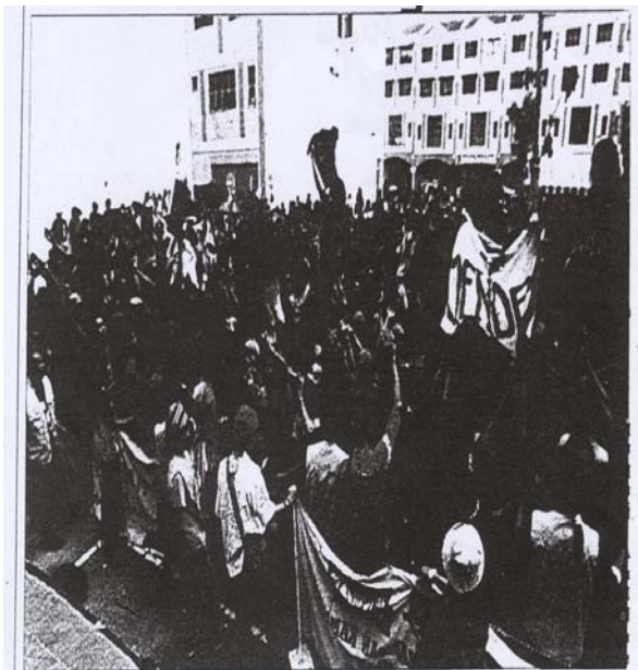
BERIBU-RIBU warga Indonesia membanjiri kawasan tempat letak kenderaan di Perumahan Jaya Suria tempat berlangsungnya konsert ‘dangdut’ di Kajang dekat Kuala Lumpur, semalam.

Berita Harian , 13 Disember: Warga Indonesia berhibur mengikut budaya “heavy metal” di mana lelaki dan perempuan bebas bergaul?